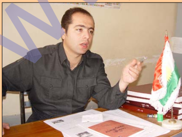
Di rûpela 6-7'an de

Li ser rewşa civaka Kurdî, jin di civaka Kurdî de, asteng û pîrsgirêkên jinan û ... Di hevpeyvînekê de tevî birêz Rambod Ltfpûrî, rojnamevan û pispor di warê civaknasiyê de