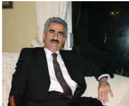
"Genev"ê de hevdîtin pêk anî.