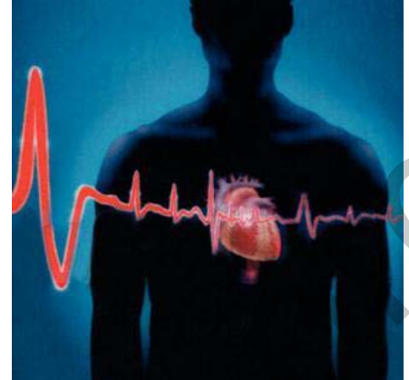
kesên ku tûşî celteya dil dibin, jordeyî 70 saliyê ne.

Serokê Civata Atriskilrozê, herwiha zêde kir ku tûşbûna ciwanên jêr 30 salî û hinek caran 23 heya 24 salî bi nexweşiyên dil weke celteya dil cihê nigeraniyê ye, li halekê ku seba encamdana çalakiyên bi cî û hewce di welatên pêşkevî de, pirsgirêka han heya astekê çareser bûye û temenê