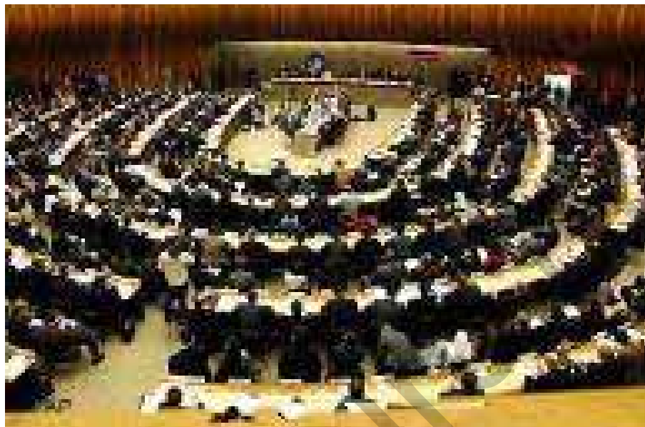
Komîteya Sêyem ya Rêxistina NY, roja Înê 29' Xezelwera 1388'ê Rojî (20'ê Mijdara 2009'an) bi derkirina biryarnamêyê, tepeserîkirina xelkê û bînpêkirina mafê mirovan ji aliyê Rejîma Komara Îslamî ve mehkûm kir

Li çarçoveya van nigeraniyên cîhanî derheq rewşax navxweyê Îranê û pêpeskirina eşkere ya mafê mirovan ji aliyê rejîmê ve, Komîteya Sêyem ya Rêxistina NY, roja Înê 29' Xezelwera 1388'ê Rojî (20'ê Mijdara 2009'an) bi derkirina biryarnamêyê, tepeserîkirina xelkê û bînpêkirina mafê mirovan ji aliyê Rejîma Komara Îslamî ve mehkûm kir û nigeraniya kûr ya xwe jî li hember van kiryarên rejîmê nîşan da û tede çend rasparde û daxwazî bo dawîanina bi