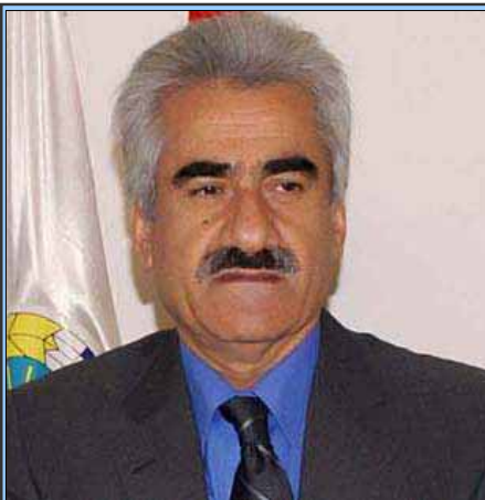
Serokê Neteweyên Yekbûyî Birêz Ban Kî Mon!