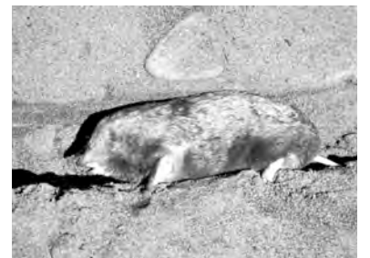
mişkê kor, koremişk, xilt, curdê kore