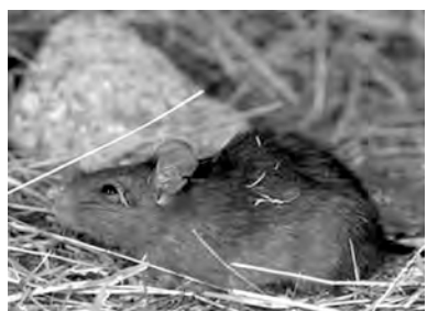
cird, circ, cirdan, cirdon