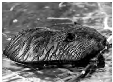
sivoreyê avê, sivoreav, qûz, kûje