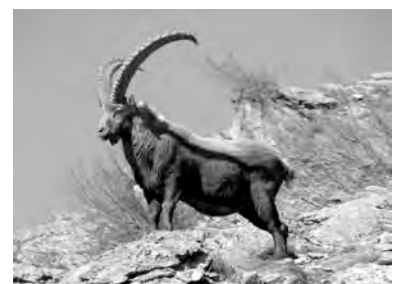
bizina kovî, bizinkovî, nêrikovî