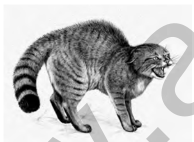
kitika kûvî, pisîka kovî, pisîka bejî