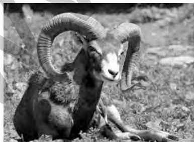
pezkovî, pezê kovî, merê kûvî