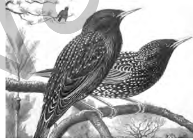
cîq, çîqreş, çûkreş, zirzûl