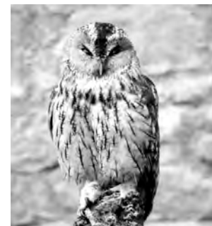
bûm, bîm, bum

KURMANCÎ MAGAZINE LINGUISTIQUE KURDE Supplément du bulletin de liaison et d'information N° C.P. : 65913 A.S. © INSTITUT KURDE DE PARIS 106, rue La Fayette, 75010 Paris - France Tel. : 00 33 (0)1 48 24 64 64 www.fikp.org Directeur de la publication : Reşo ZÎLAN Réalisation : S. ILITCH & M. HASSAN