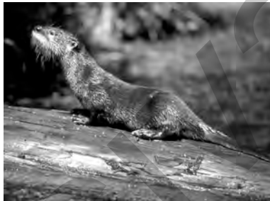
seyê avê, segav