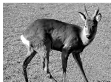
ask, mamiz, xezala çiyayî, şeçil, şift