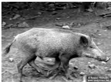
berazê kovî, berazkûvî, berazê birra