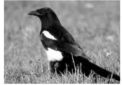
qelabaçke, qeşqilank, qijika belek, qijika dûvmisas, qişqil