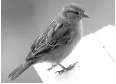
beytik, çirtok, çivîk, çûkên malan, çûncik, guncêşk, pasarî, pasavî, şivandîlke