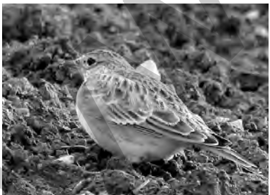
kolke, çûka navzeviyan, zîrzîrk, zîrzîrka şamî