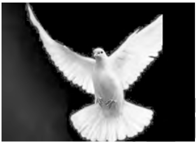
kevok, kevotar, kotir