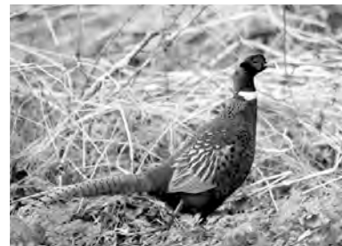
çor, tîtav, qerqewîl