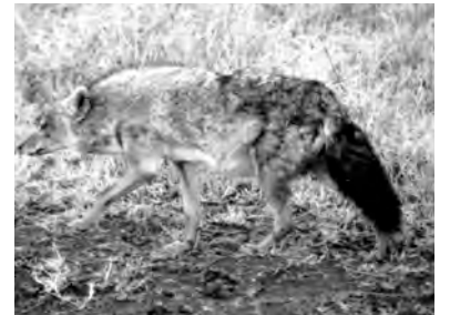
wawîk, çeçel, tûrk, tûrî, tûrge