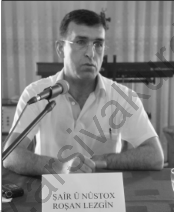
Roşan Lezgîn Çewlîgî de

Program de Roşanî yew şîra xo (Ruho Vîndîbîyaye) zî wende. Peynî de Roşanî da-hîris tene kitabê xo îmza kerdî û wendoxanê xo reyde