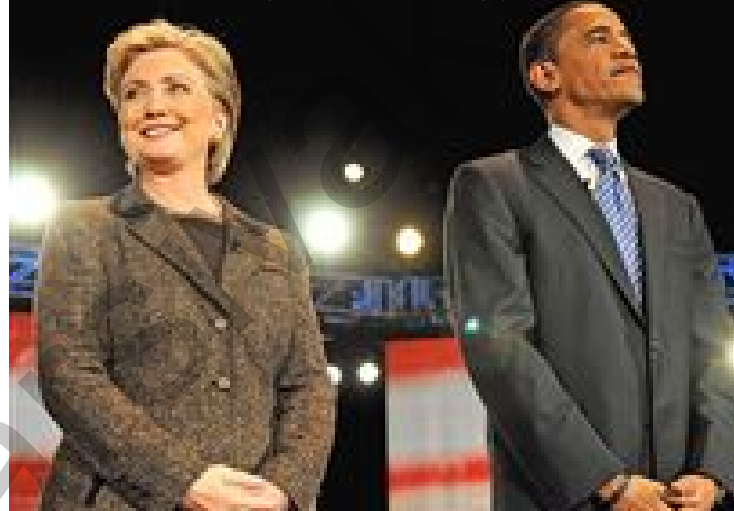
Berendamê/a Partiya Demokrat, Hillary yan Obama?

Heqîqet ew e ku cihê van sîsteman di vê dinyaya me de nîne û nabe hebe jî. Û herweha bêguman me kurdan jî dinyayek li gor dilê xwe divê ku di wir de cih û rola me kurdan bi awayekî zelal û xurt hebe. Em jî weku hemû milletên azad yên dinê xwedî mafên xwe yên