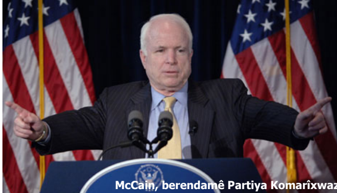
McCain, berendamê Partiya Komarîxwaz

Siyaseteke wê ji bo kurdan, hema bêje gellek zelal, heye. Ew dixwaze bingeha eskerên Amerîkayê ji Îraqê bibe li Başûrê