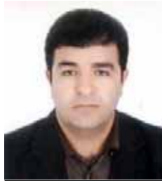
Ebdulrezaq Muradazer Kadroyê PDKÎ

Derçûna hejmara 100'an ji we û hemû xwendevanên we pîroz dikim û hêviya serkevtin û berdewamiyê bo we dixwazim.