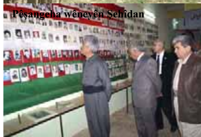
Pêşangaha wêneyên Şehîdan