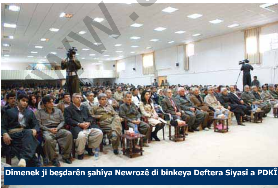
Dîmenek ji beşdarên şahîya Newrozê di binkeya Deftera Siyasî a PDKÎ