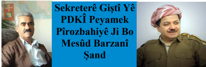
Sekreterê Giştî Yê PDKÎ Peyamek Pîrozbahiyê Ji Bo Mesûd Barzanî Şand

sîstema nedemokratîk a Wilayeta Feqîh dagirtiye, derfeta referendom yan rapirsîkirina giştî di çarçoveya Qanûna Bîngehîn de çêbibe, ew jî li ser kêmkirina desthilata Konseya Parêzvan ku yek ji organên sereke yê wê rejîmê ye û derbasbûn ji wê tê wateya bazdan ji Wilayeta Feqîh.