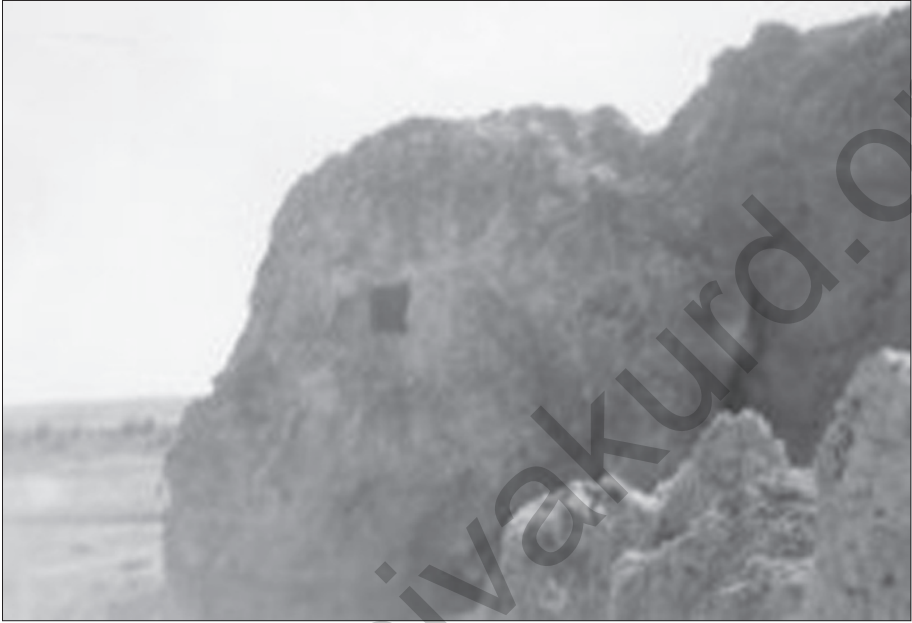
Rijnayîşî ra ver Kerrey Isporî

dest ra yeno çîyo weş virazeno û cayo bîn de zî însan şono rehet-rehet rijnenê.